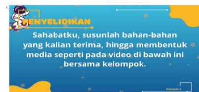
Gambar 4 tahap penyelidikan