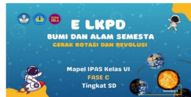
Gambar 1 cover

dan penilaian yang relevan. Rencana pengembangan produk untuk mengatasi masalah yang ada di SD yaitu pengembangan produk e-LKPD berbasis model PBL yang bertujuan meluaskan pemahaman berpikir kognitif peserta didik sekolah dasar.