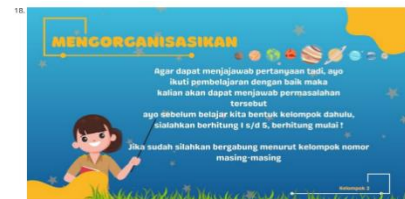
Gambar 3 tahap mengorganisasikan