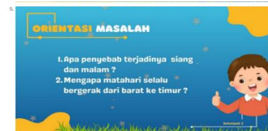
Gambar 2 Tahap Orientasi