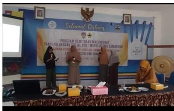
Gambar 6. Peserta Praktik Dialog Menggunakan Unggah-ungguh Bahasa Jawa

Berangkat dari keseriusan peserta dalam mengikuti pelatihan, menginspirasi Kepala Pantii Pelayanan Sosial Mardi Utomo Semarang berkomitmen untuk melanjutkan program pelatihan penggunaan unggah-ungguh ini dengan materi yang lain, dengan harapan seluruh pegawai dan penerima manfaat memiliki kemampuan berbahasa Jawa yang baik dalam