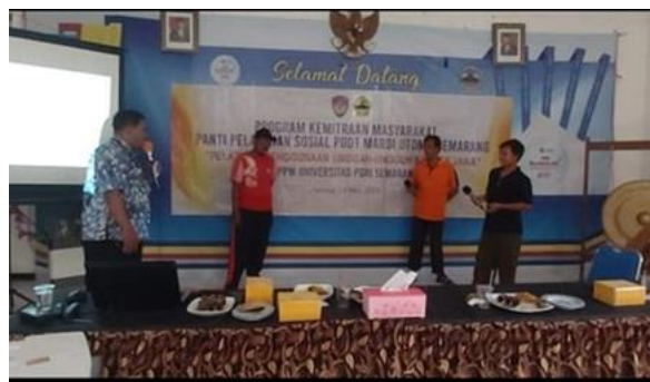
Gambar 5. Peserta Praktik Dialog Menggunakan Unggah-ungguh Bahasa Jawa