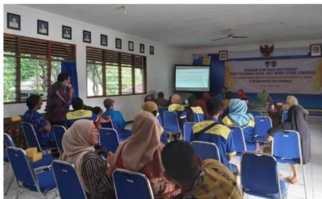
Gambar 3. Peserta Mengajukan Pertanyaan