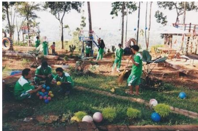
Gambar 1. Kegiatan Penerima Manfaat di Panti Sosial PGOT Mardi Utomo

Panti Pelayanan Sosial Mardi Utomo Semarang adalah unit pelaksana teknis dari Dinas Sosial yang memberikan pelayanan kesejahteraan sosial di bidang rehabilitasi sosial yang berupa bimbingan fisik, bimbingan mental, bimbingan sosial dan bimbingan keterampilan serta bimbingan resosialisasi untuk kurun waktu minimal 6 bulan dan maksimal 12 bulan bagi Pengemis, Gelandangan dan Orang Terlantar (PGOT). Di panti tersebut, terdapat gelandangan pengemis dan orang terlantar yang diberi layanan atau bimbingan agar mampu mandiri dan berperan aktif kembali dalam kehidupan di tengah masyarakat ( https://kumparan.com/sholi/panti-pelayanan-sosial-mardi-utomo-telah-berdiri-sejak-orde-baru-1zuUOryTiWJ ).