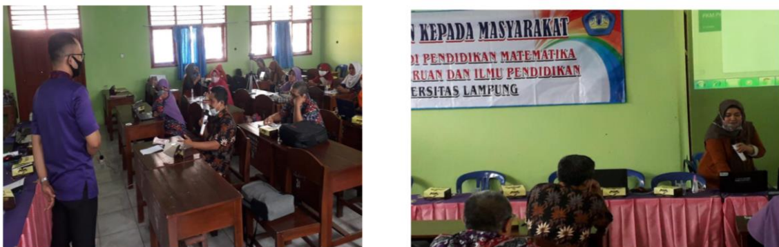
Gambar 1. Pemaparan Materi oleh Tim Pelaksana Pengabdian

Penanggukan pendaftaran akun baru pada schoolology ini menjadi kendala dalam melakukan bimbingan teknis mengingat para peserta belum memiliki akun di schoolology . Selain itu, hasil pretest juga menunjukkan bahwa para guru belum memiliki pemahaman dan keterampilan yang cukup terkait pemanfaatan google classroom dalam pembelajaran daring. Oleh karena itu, pemberian materi terkait google classroom sangat relevan dan dibutuhkan oleh para guru. Meskipun demikian, schoolology tetap dikenalkan kepada para guru guna menambah pemahaman para guru terkait variasi LMS yang dapat dimanfaatkan dalam pembelajaran daring. Kegiatan hari pertama ini berlangsung lancar yang ditunjukkan dengan kehadiran dan keaktifan guru dalam mengikuti setiap paparan materi yang diberikan oleh tim pelaksana. Para guru juga aktif mengajukan pertanyaan terhadap materi-materi yang belum dipahami.